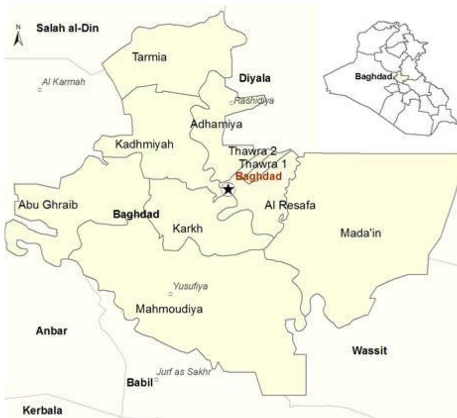
Karta över Bagdadprovinsen: Joint Analysis and Policy Unit (JAPU) 76