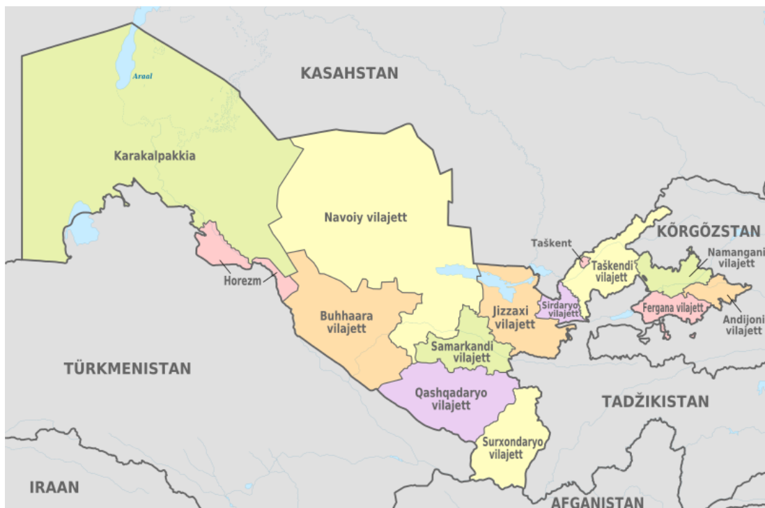
Mapa. Podział administracyjny Uzbekistanu. [8]

provincje/regiony, podzielone są na okręgi (uzb. tuman) i dalej na jeszcze mniejsze podmioty. [7]