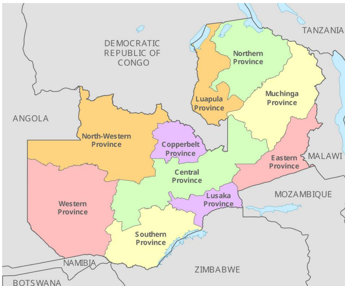
Mapa. Podział administracyjny Zambii. [12]