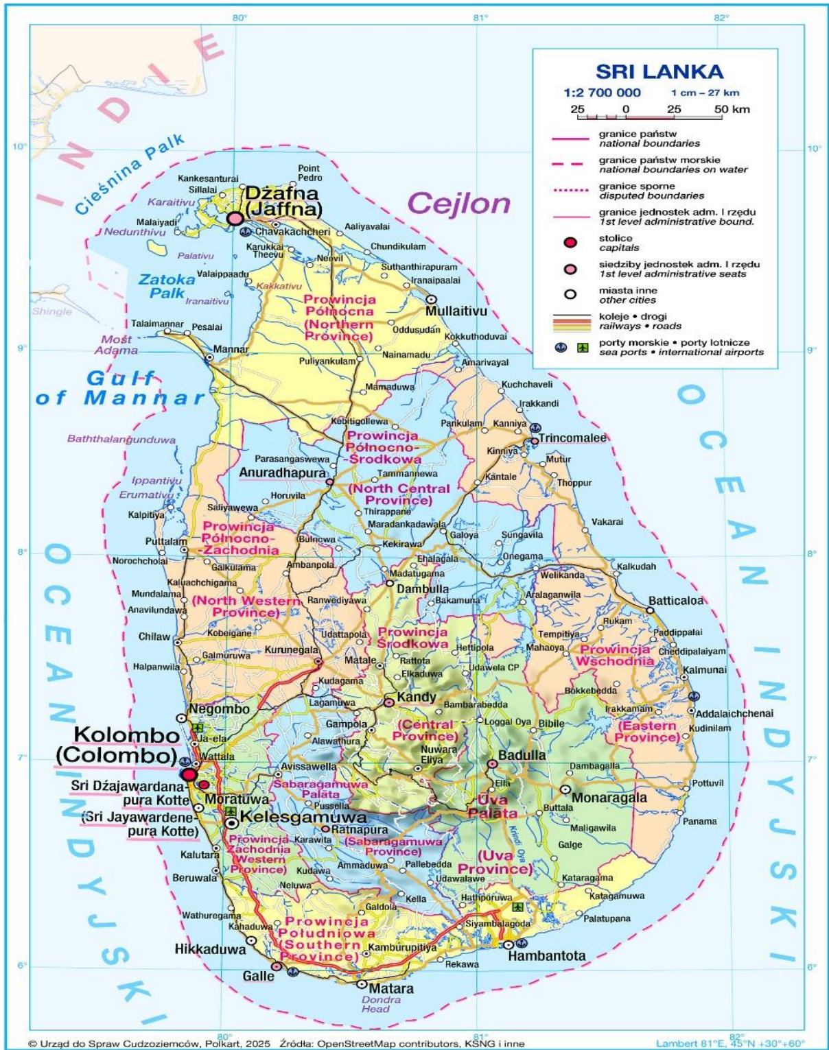
Mapa. Podział administracyjny Sri Lanki.