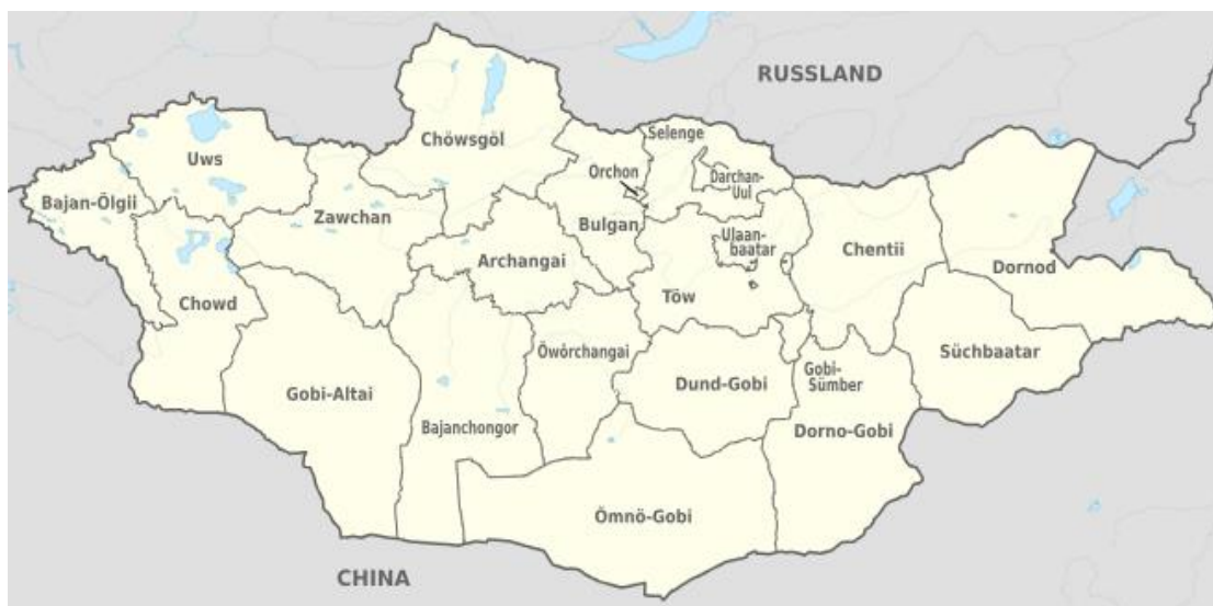
Mapa. Podział administracyjny Mongolii. [8]

Ajmaky dzielą się na somony (odpowiedniki powiatów). [7]