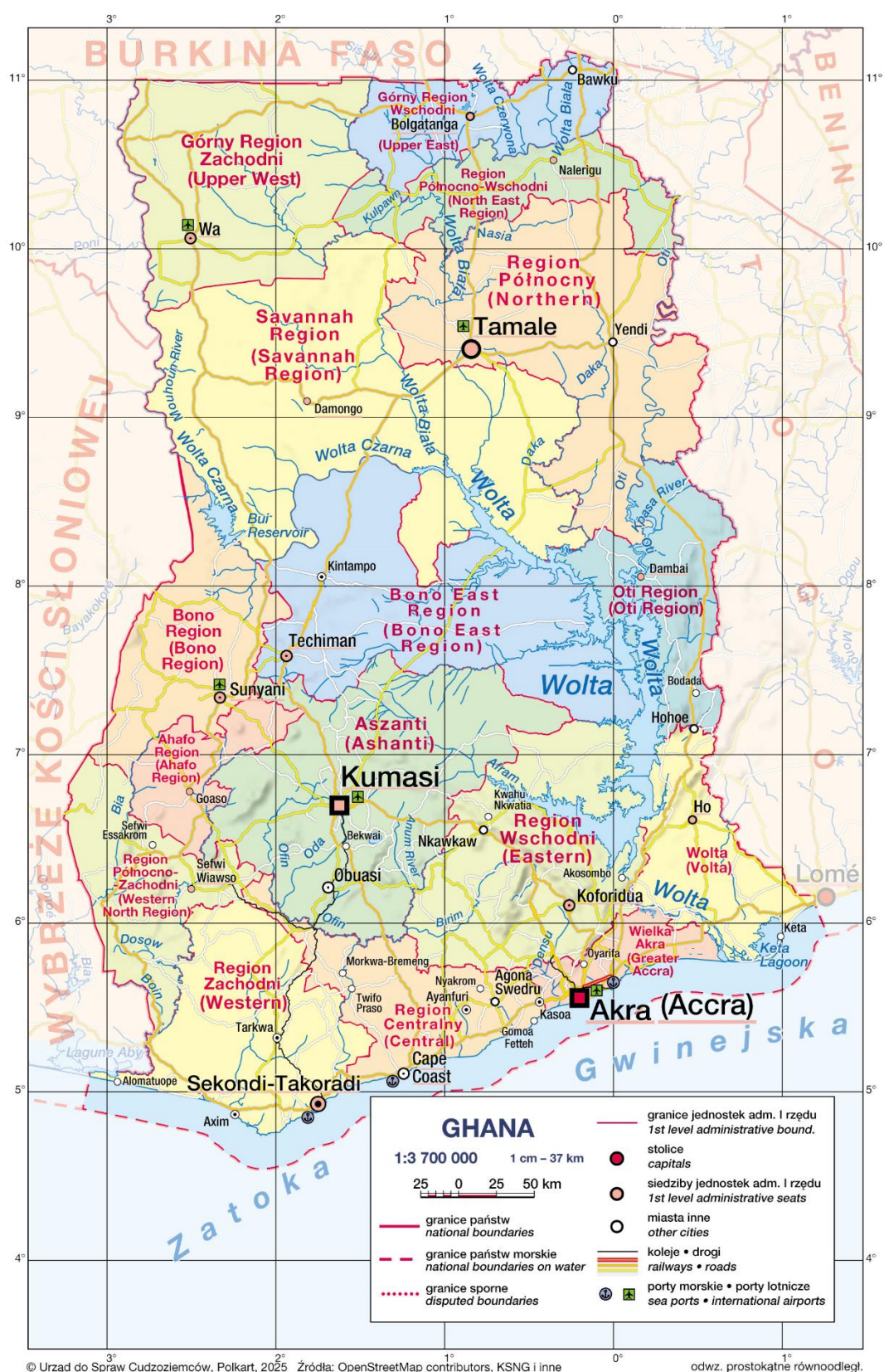
Mapa. Podział administracyjny Ghany