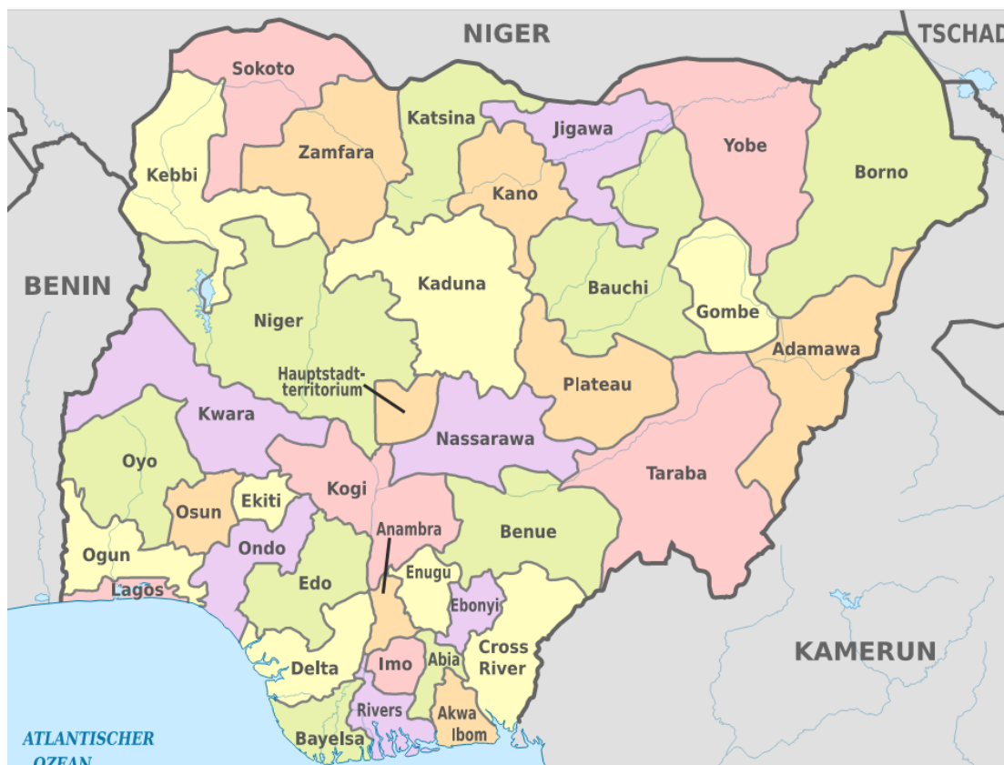
Mapa. Podział administracyjny Nigerii [16]

Stany podzielone są na mniejsze jednostki samorządu terytorialnego (ang. Local Government Areas – LGAs), których jest łącznie 774. [15]