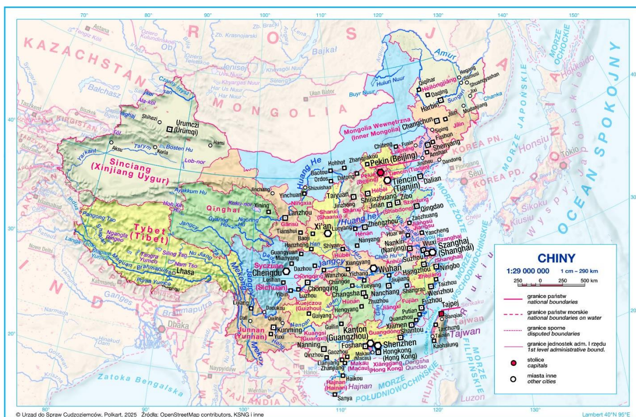
Mapa. Podział administracyjny Chin.

Wydzielone są także 4 miasta, które funkcjonują również na prawach prowincji, pod bezpośrednim zarządem władz centralnych: Pekin, Tiencin, Szanghaj i Chongqing. W skład Chin wchodzi również 5 regionów autonomicznych (zamieszkiwanych przez skupione grupy etniczne): Guangxi, Mongolia Wewnętrzna, Tybet, Xinjiang-Uygur i Ningxia. Ponadto do Chin należą też 2 specjalne regiony administracyjne: Honkong i Makau. [7]