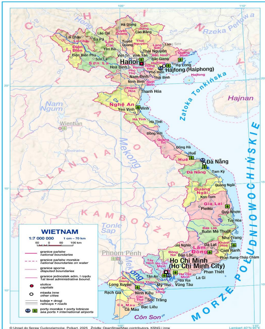
Mapa. Podział administracyjny Wietnamu.