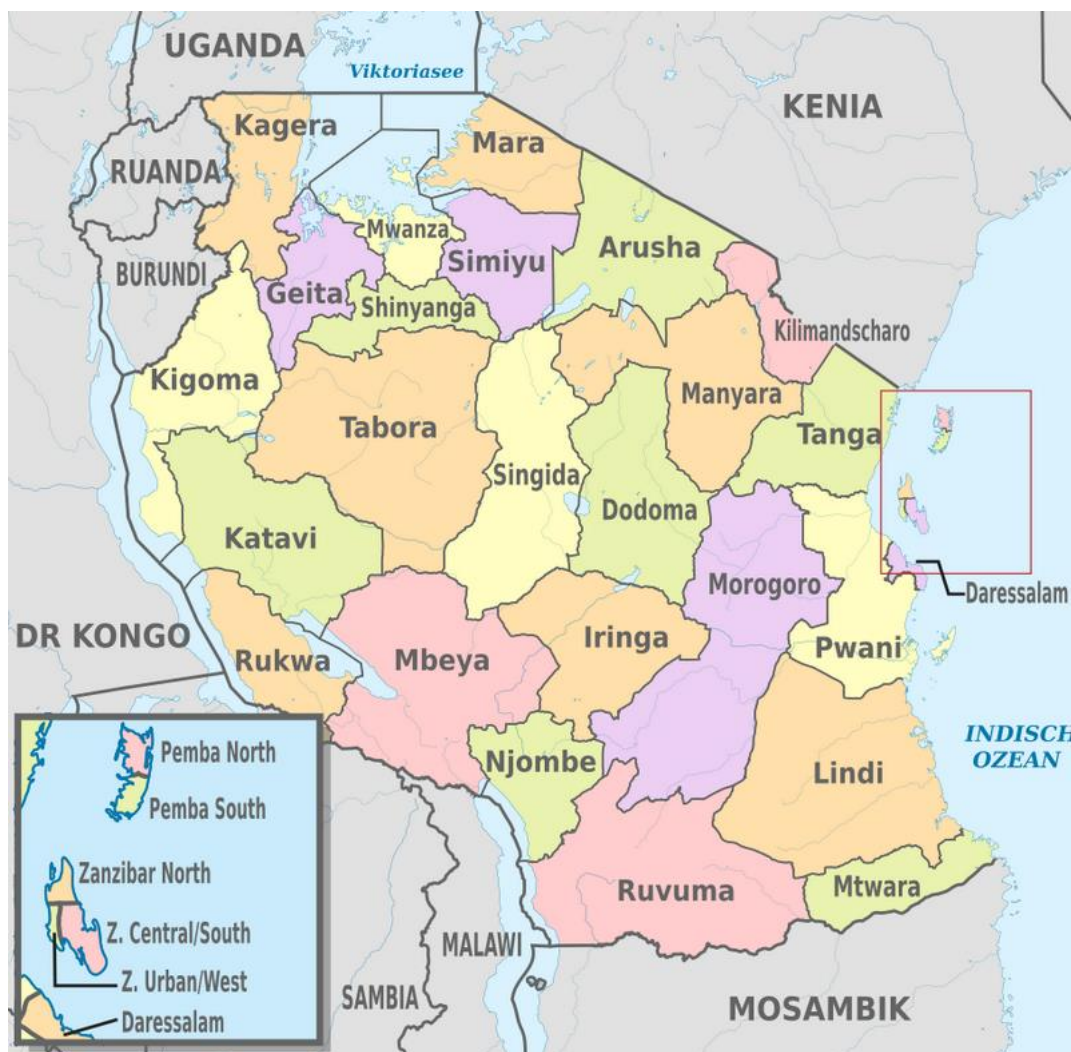
Mapa. Podział administracyjny Tanzanii. [22]

(Zanzibar Urban/West), Morogoro, Mtwara, Mwanza, Njombe, Pwani (Coast), Rukwa, Ruvuma, Shinyanga, Simiyu, Singida, Songwe, Tabora, Tanga. [21]