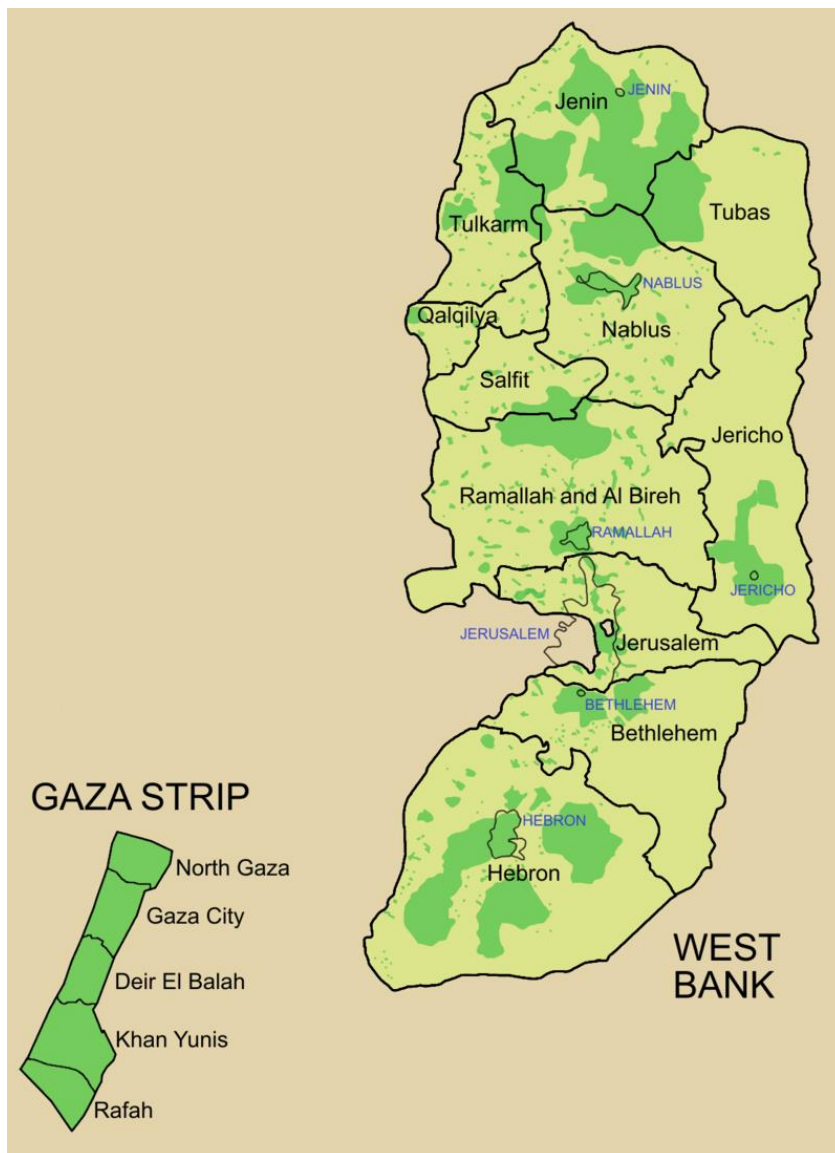
Podział administracyjny Autonomii Palestyńskiej [30]

Obszar Autonomii Palestyńskiej jest podzielony na 16 .provincji (muhafaz): 11 na Zachodnim Brzegu (Nablus, Kalkilija, Tubas, Salfit, Tulkarem, Dżenin, Jerycho i Dolina Jordanu, Ramallah i al-Bira, Betlejem, Hebron i Jerozolima) oraz 5 w Strefie Gazy (Północna Gaza, Gaza, Dajr al-Balah, Chan Junis oraz Rafah). [29]