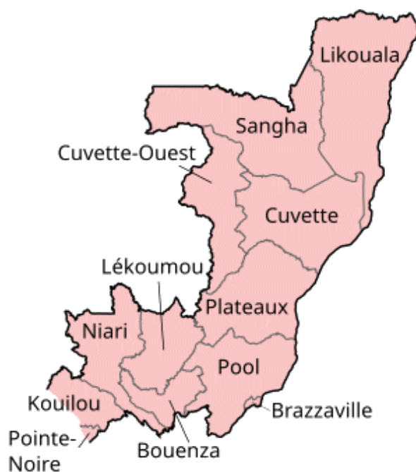
Mapa. Podział administracyjny Republiki Konga. [6]