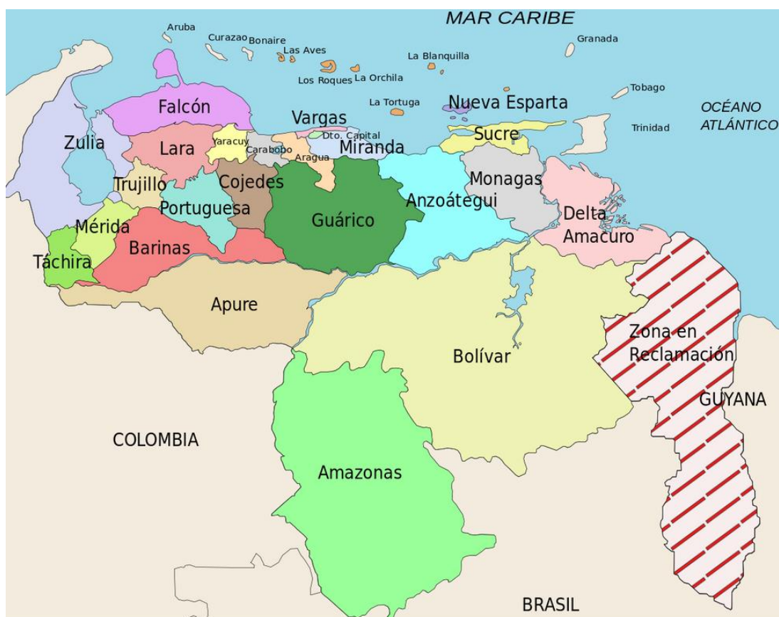
Mapa. Podział administracyjny Wenezueli. [8]

Stanami Wenezueli są: Amazonas, Anzoátegui, Apure, Aragua, Barinas, Bolívar, Carabobo, Cojedes, Delta Amacuro, Falcón, Guárico, Lara, Mérida, Miranda, Monagas, Nueva Esparta, Portuguesa, Sucre, Táchira, Trujillo, Vargas, Yaracuy i Zulia. Stany podzielone są na 335 gmin ( municipios ), które z kolei dzielą się na ponad tysiąc parafii ( parroquias ). [7]