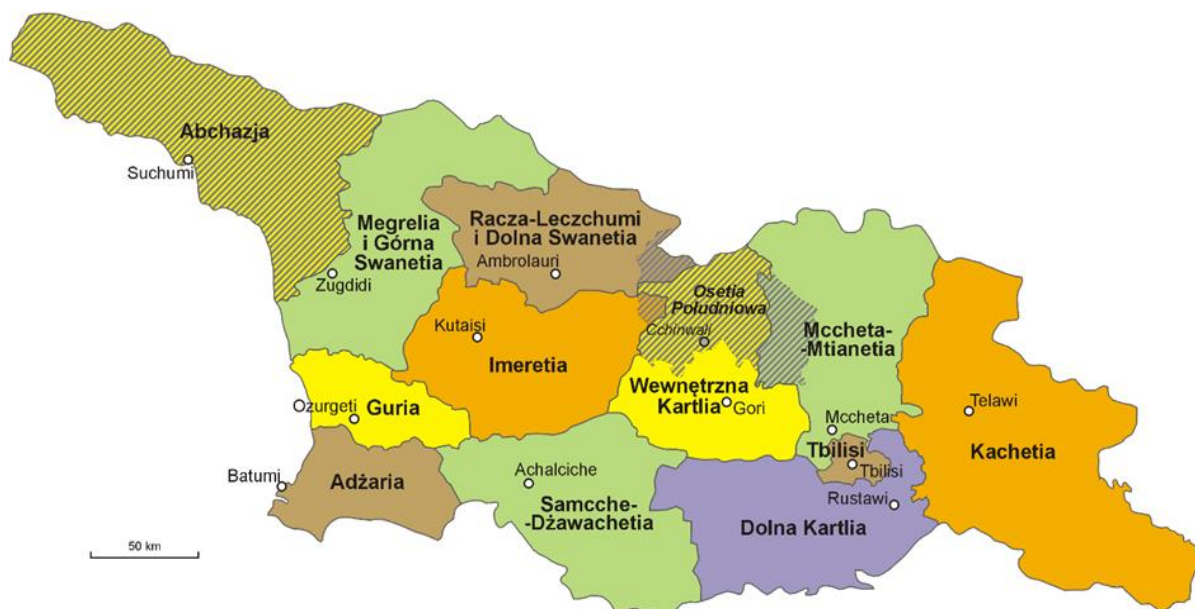
Mapa. Podział administracyjny Gruzji [12]

Władze gruzińskie nie sprawują kontroli nad separatystyczną Autonomiczną Republiką Abchazji i regionem Cchinwali (Osetią Południową). [9][10][11]