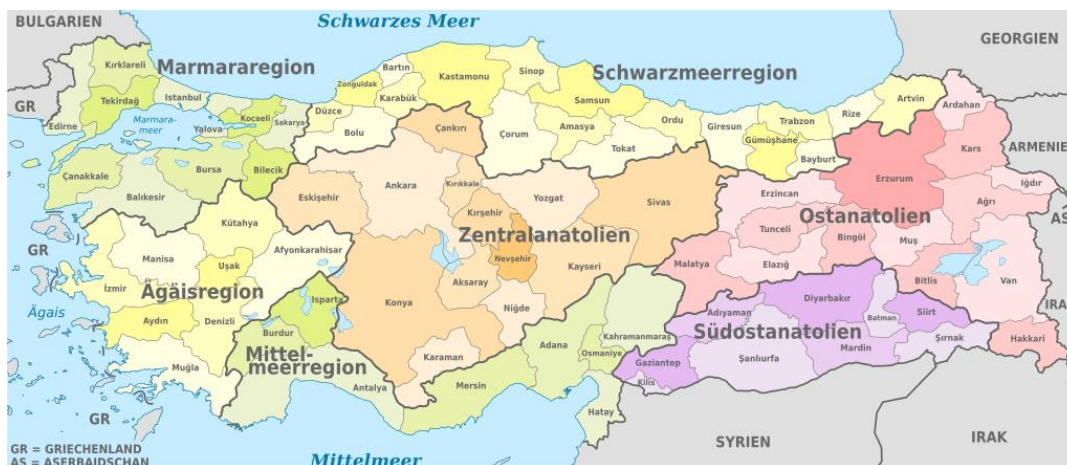
Mapa. Podział administracyjny (Turcja) [5]