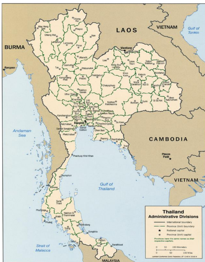
Mapa. Podział administracyjny Tajlandii. [9]

76 prowincji i 1 gmina*: Amnat Charoen, Ang Thong, Bueng Kan, Buri Ram, Chachoengsao, Chai Nat, Chaiyaphum, Chanthaburi, Chiang Mai, Chiang Rai, Chon Buri, Chumphon, Kalasin, Kamphaeng Phet, Kanchanaburi, Khon Kaen, Krabi, Krung Thep* (Bangkok), Lampang, Lamphun, Loei, Lop Buri, Mae Hong Son, Maha Sarakham, Mukdahan, Nakhon Nayok, Nakhon Pathom, Nakhon Phanom, Nakhon Ratchasima, Nakhon Sawan, Nakhon Si Thammarat, Nan, Narathiwat, Nong Bua Lamphu, Nong Khai, Nonthaburi, Pathum Thani, Pattani (Patani) [7] , Phangnga, Phatthalung, Phayao, Phetchabun, Phetchaburi, Phichit, Phitsanulok, Phra Nakhon Si Ayutthaya, Phrae, Phuket, Prachin Buri, Prachuap Khiri Khan, Ranong, Ratchaburi, Rayong, Roi Et, Sa Kaeo, Sakon Nakhon, Samut Prakan, Samut Sakhon, Samut Songkhram, Saraburi, Satun, Sing Buri, Si Sa Ket, Songkhla, Sukhothai, Suphan Buri, Surat Thani, Surin, Tak, Trang, Trat, Ubon Ratchathani, Udon Thani, Uthai Thani, Uttaradit, Yala, Yasothorn. [8]