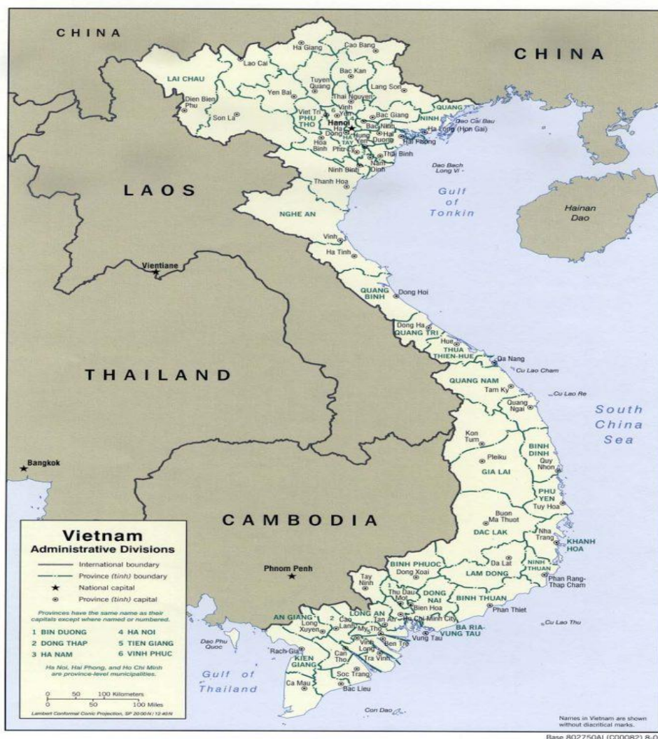
Mapa. Podział administracyjny Wietnamu. [9]