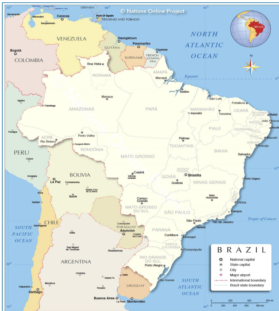
Mapa. Administracyjna mapa Brazylii. Źródło: Nations Online Project, Administrative Map of Brazil, https://www.nationsonline.org/oworld/map/brazil-administrative-map.htm [9]

Catarina, Sao Paulo, Sergipe, Tocantins. Wszystkie stany dzielą się na mezoregiony, które to dzielą się na mikroregiony, natomiast te na gminy [6] [7]. [8]