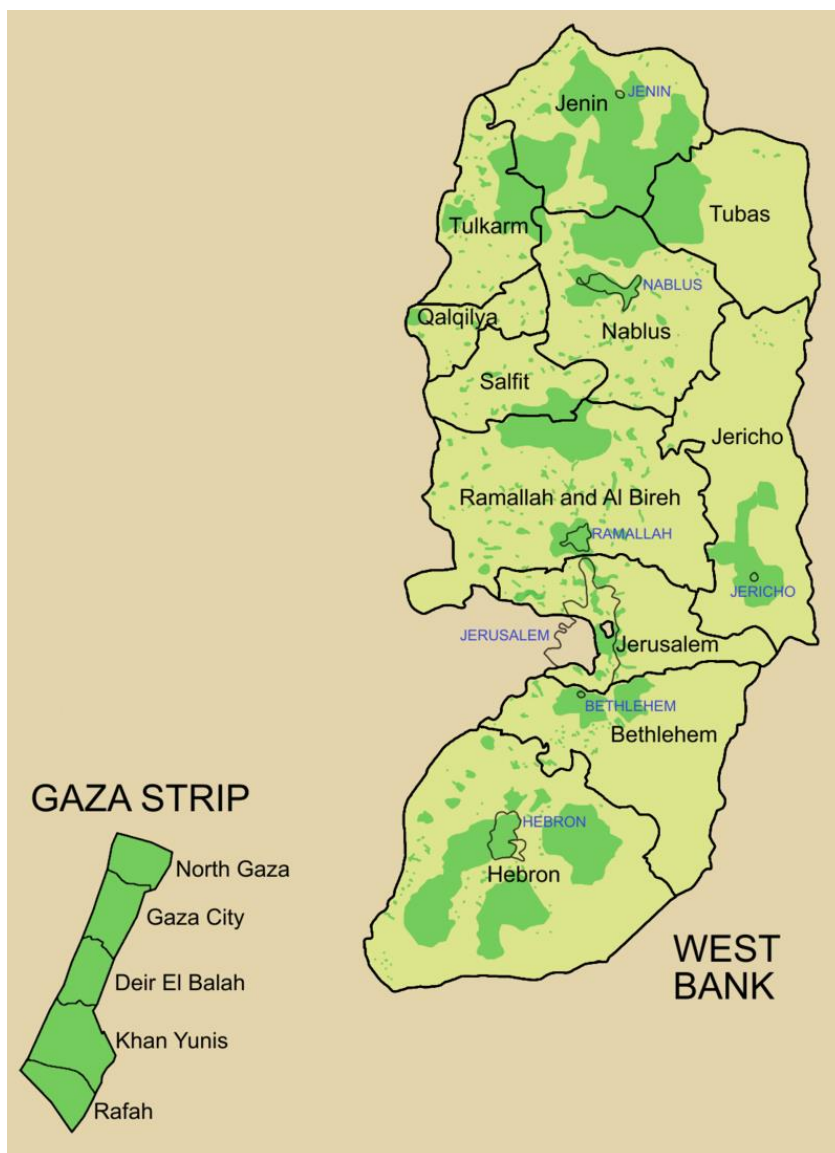
Mapa. Podział administracyjny Autonomii Palestyńskiej. [32]

Obszar Autonomii Palestyńskiej jest podzielony na 16 .prowincji (muhafaz): 11 na Zachodnim Brzegu (Nablus, Kalkilija, Tubas, Salfit, Tulkarem, Dżenin, Jerycho i Dolina Jordanu, Ramallah i al-Bira, Betlejem, Hebron i Jerozolima) oraz 5 w Strefie Gazy (Północna Gaza, Gaza, Dajr al-Balah, Chan Junis oraz Rafah). [31]