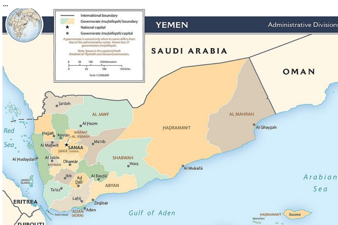
Mapa. Podział administracyjny Jemenu. [12]

Kraj podzielony jest na 22 prowincje – muhafazy (łącznie z wydzielonym do celów statystycznych i wyborczych miastem stołecznym – Saną): Abjan, Aden, Ad-Dali, al-Bajda, al-Hudajda, al-Dżauf, Mahran, al-Mahwit, Amanat al-Asima (prowincja stołeczna Sany), Amran, Sokotra, Damar, Hadramawt, Hadżdża, Ibb, Lahidż, Marib, Rajma, Saada, Sana, Szabwa, Taizz. [10] Muhafazy dzielą się na okręgi – mudiriya oraz subokręgi – uzla. [11]