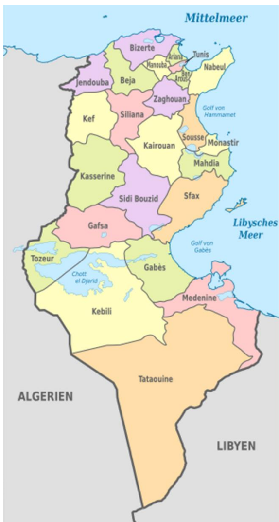
Mapa. Prowincje Tunezji. [7]