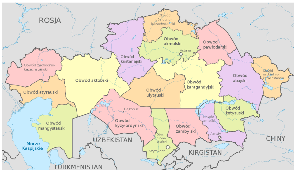
Mapa. Administracyjny podział Kazachstanu po reformie w 2022 r. [8]