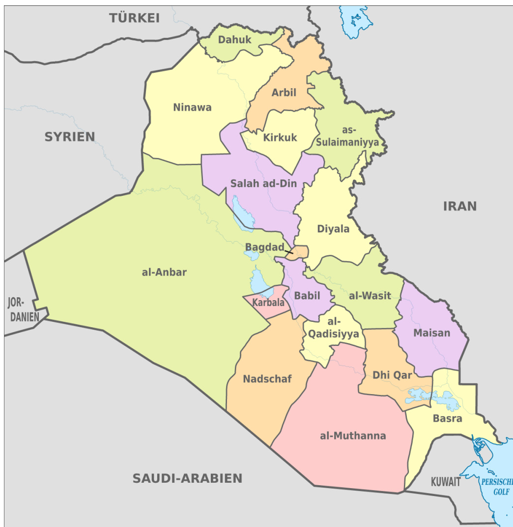
Mapa. Podział administracyjny Iraku. [6]

Gubernie dzielą się na dystrykty (arab. kaza), których jest 120. [7]