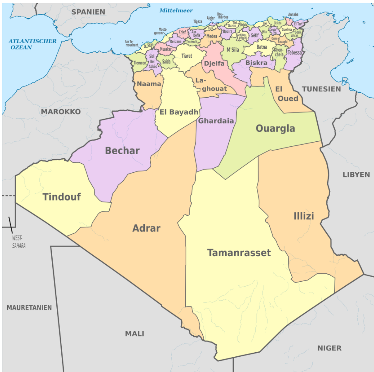
Mapa. Podział administracyjny Algierii [5]