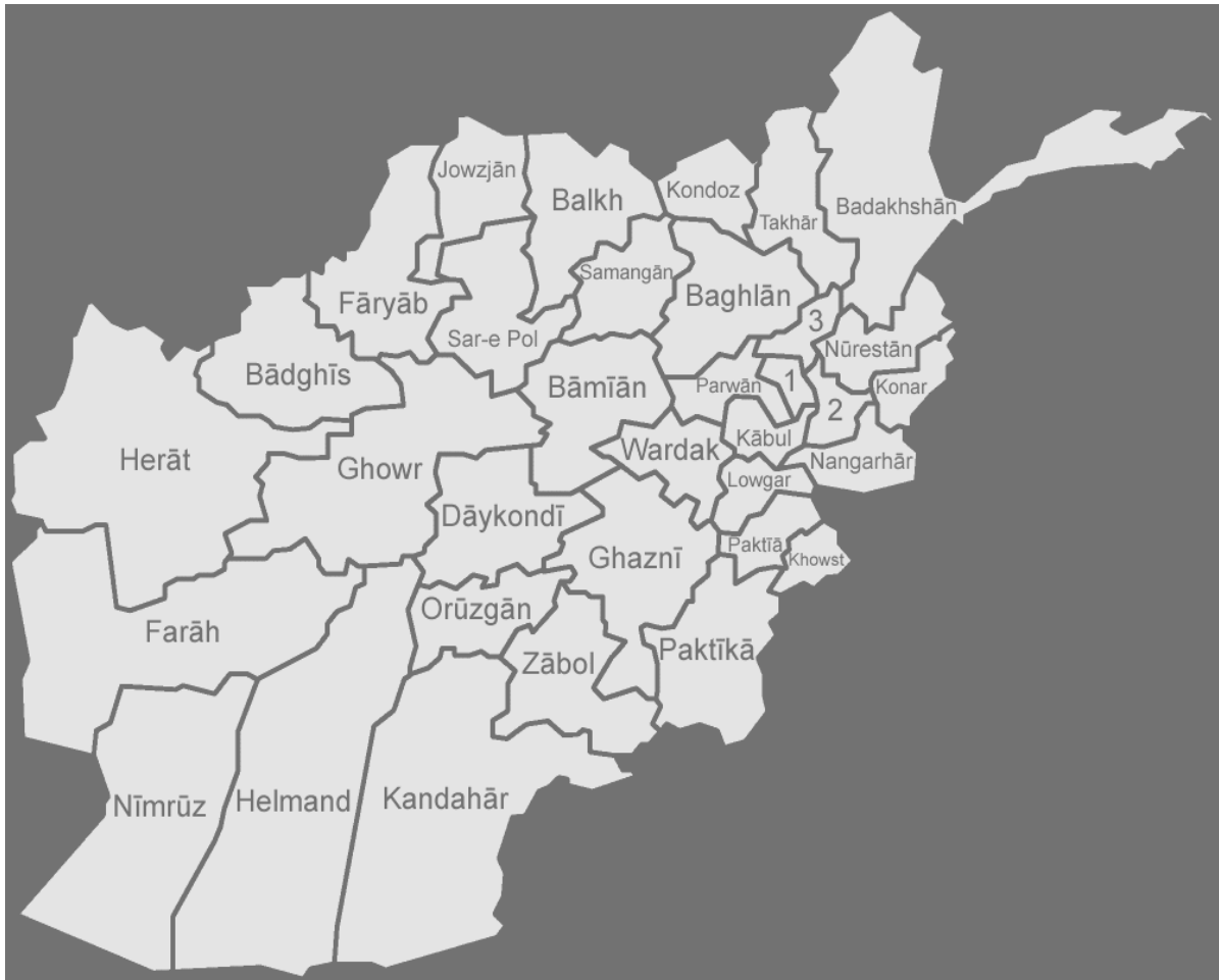
Mapa. Podział administracyjny Afganistanu. Prowincje: 1 - Kapisa; 2 - Laghman; 3 – Pandżaszir. [5]