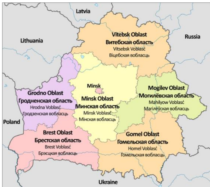
Mapa. Podział administracyjny Białorusi [11]

Białoruś administracyjnie jest podzielona na 6 obwodów (biał. Вобласць, voblasts'; ros. Область; ang. Provinces) z centrami administracyjnymi w takich miastach, jak: Mińsk (biał. Мінск, hist. Менск; ros. Минск), Brześć (biał. Брэст; ros. Брест), Witebsk (biał. Віцебск; ros. Витебск), Homel (biał. Гомель; ros. Гомель), Grodno (biał. Гродна; ros. Гродно) i Mohylew (biał. Магілёў; ros. Могилев). Obwody z kolei dzielą się na: 118 rejonów, 115 miast, 85 osad typu miejskiego i 23 027 wsi. [12][13]