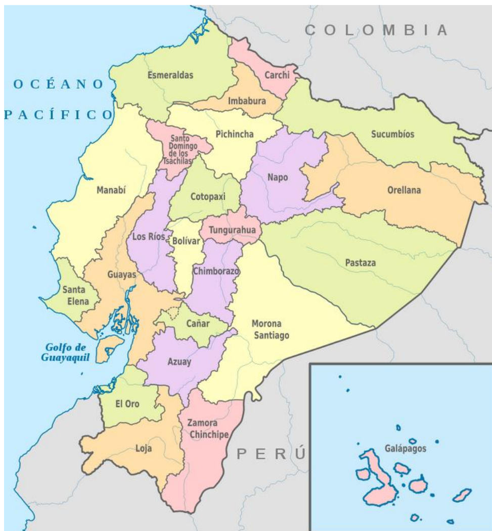
Mapa. Podział administracyjny Ekwadoru. [7]