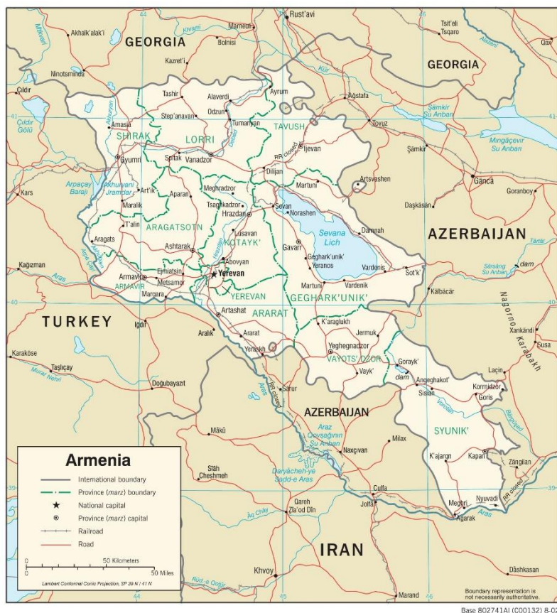
Mapa. Podział administracyjny Armenii. [6]