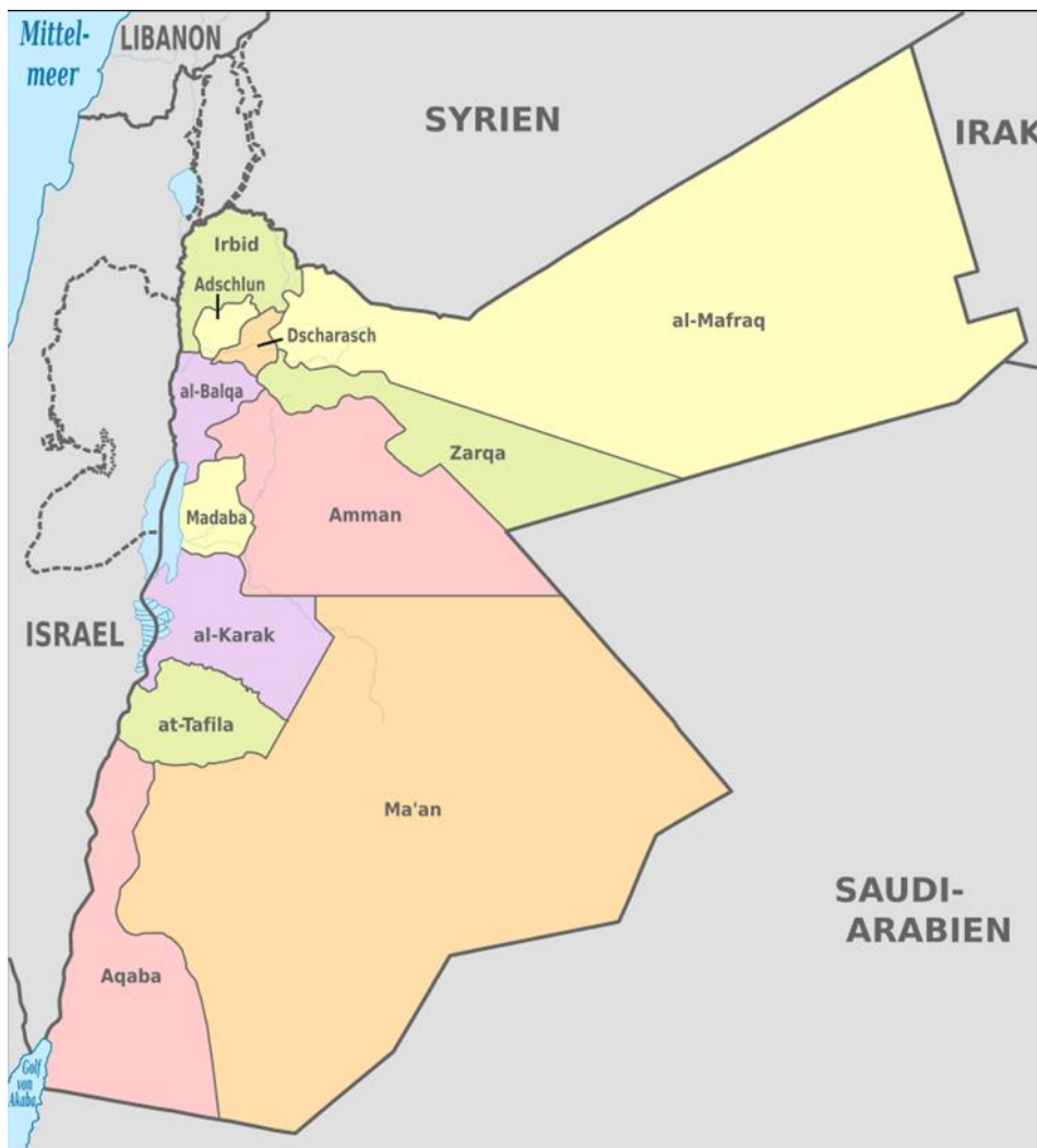
Mapa. Podział administracyjny Jordanii [10]

Prowincje dzielą się na okręgi ( liwa ), a te z kolei dzielą się na podokręgi ( kada ). [9]