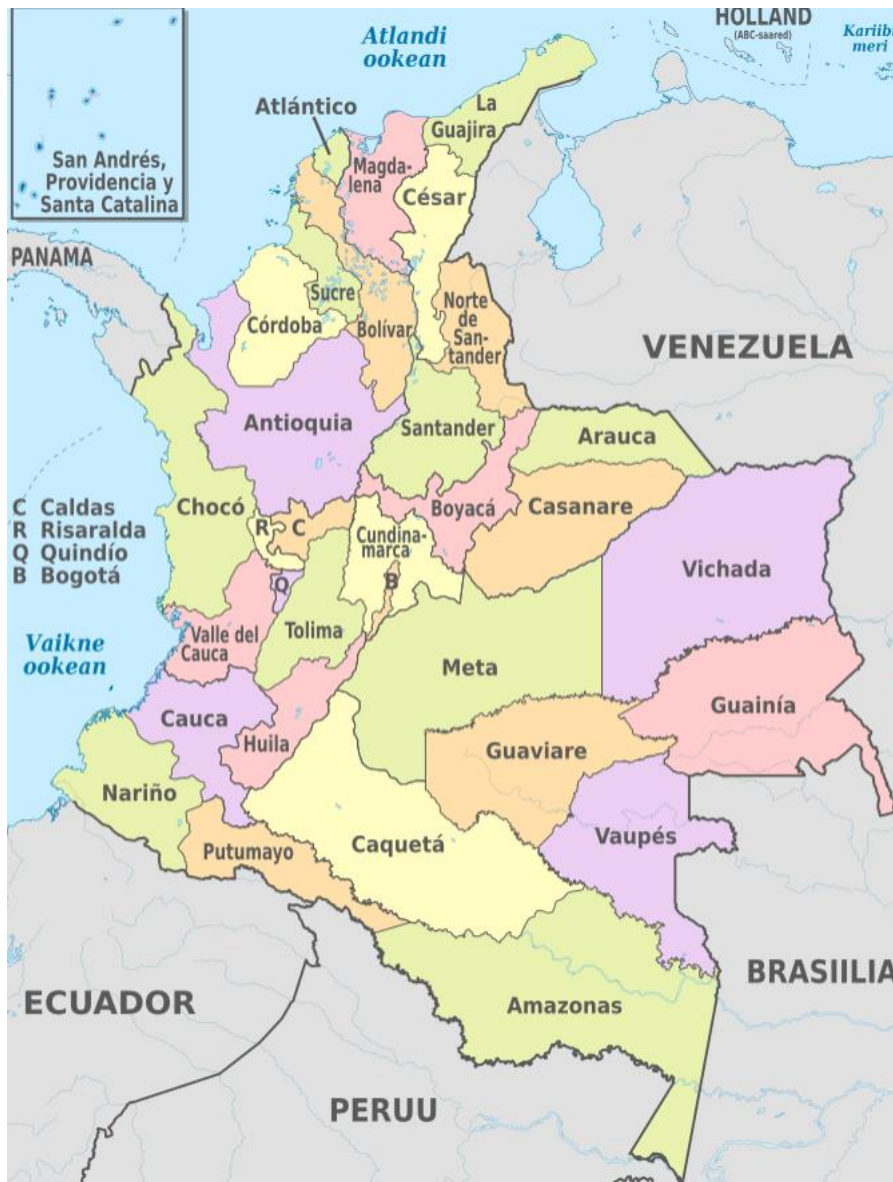
Mapa. Podział administracyjny Kolumbii. [6]