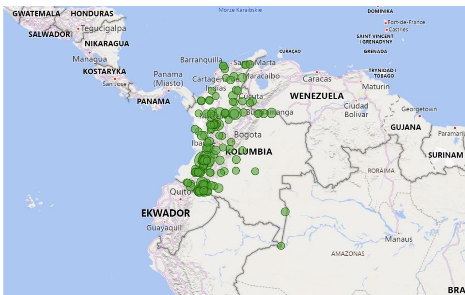
Mapa. Regiony największego ryzyka dla ludności cywilnej w okresie: 01.04.2023-31.03.2024, na podstawie danych ACLED [58]

Większość aktów przemocy ma miejsce na terenach wiejskich, natomiast stolica kraju, Bogota pozostaje stosunkowo bezpiecznym miejscem. [57]