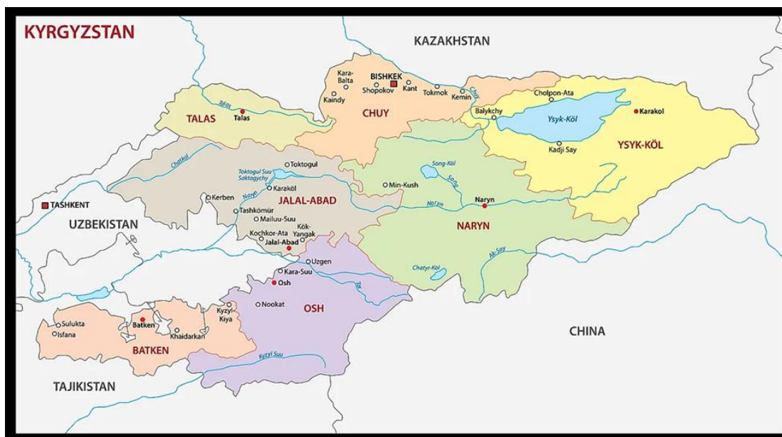
Mapa. Podział administracyjny Kirgistanu [6]