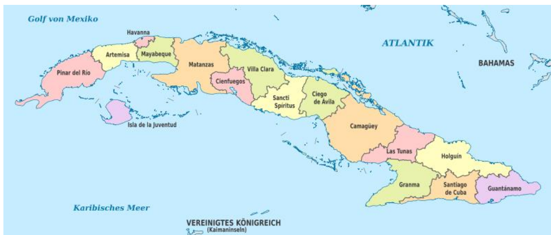
Mapa. Podział administracyjny Kuby [7]