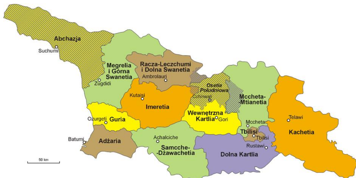
Mapa Gruzji. Podział administracyjny ( https://pl.wikipedia.org/wiki/Gruzja?uselang=pl )

oraz miasto wydzielone (j. gruz.: kalaki), którym jest stolica Tbilisi. Regiony podzielone są z kolei na 67 prowincji i 11 miast. [6]