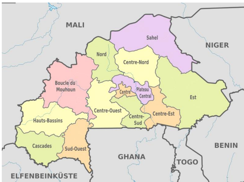
Mapa administracyjna Burkina Faso. [6]