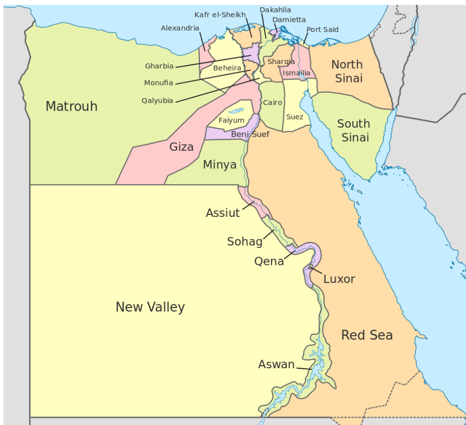
Podział administracyjny Egiptu. [7]