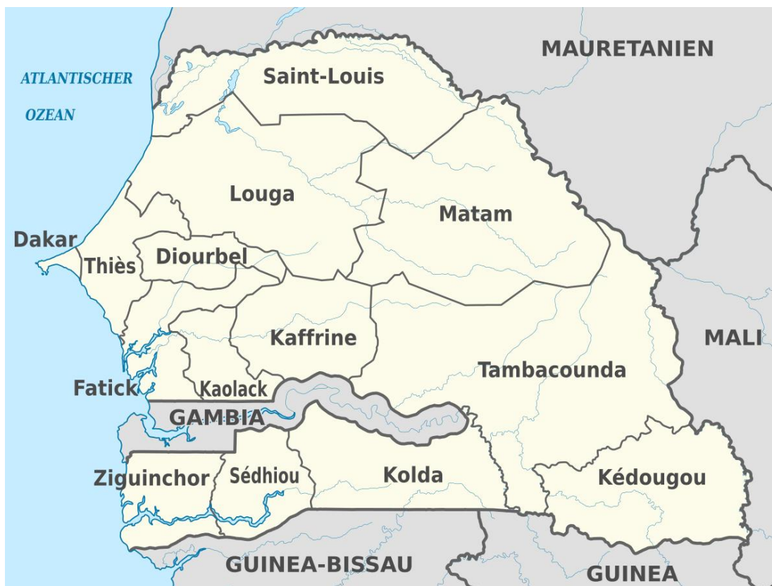
Mapa podziału administracyjnego Senegalu [9]