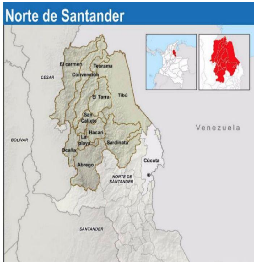
Kaart: Regio Catatumbo 1

De regio Catatumbo, gelegen in het departement Norte de Santander, is een uitgestrekt heuvel- en berggebied in het noordoosten van Colombia, grenzend aan de Venezolaanse deelstaat Zulia. De regio omvat elf gemeenten 2 en heeft een bevolking van 377.346 inwoners, van wie 3.018 personen van het inheemse Barí- volk. De inwoners wonen vooral in de gemeenten Ocaña, Tibú en Ábrego. De regio staat ook onder aanzienlijke migratiedruk, met meer dan 42.000 Venezolaanse migranten geregistreerd in 2025. De gemeenten zijn geografisch geïsoleerd, met beperkte wegverbindingen naar Cúcuta, de hoofdstad van Norte de Santander. De inwoners kennen ook structurele barrières in de toegang tot basisdiensten, vooral in de landelijke gebieden waar meer dan 80 % van de basisbehoeften onvervuld blijft. De staatsaanwezigheid is structureel zwak: publieke diensten zoals gezondheidszorg, onderwijs en rechtshandhaving zijn in grote delen van de regio afwezig of beperkt. 3