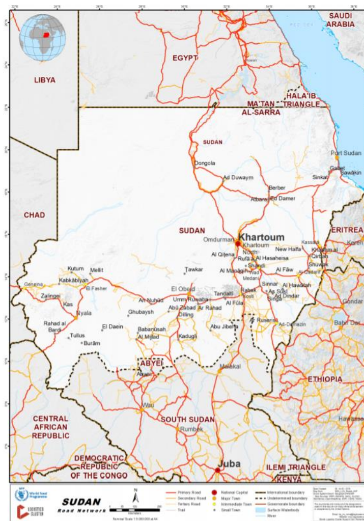
Figuur 3: Sudan Road Network (08/08/2018) 17

Onderstaande kaart toont het wegennetwerk in Soedan, en geeft de wegen weer die Khartoem via de stad El Obeid in Noord-Kordofan met verschillende plaatsen en steden in Darfoer verbindt. 16