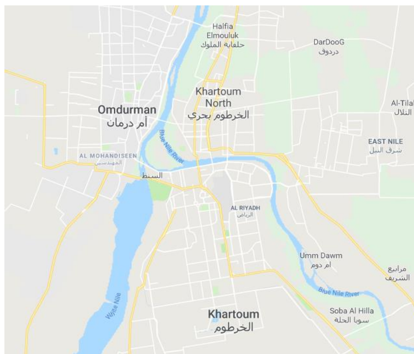
Figuur 1: Khartoum, Sudan (Google Maps) 4

De grootste stedelijke agglomeratie van Soedan bevindt zich rondom de hoofdstad Khartoem, aan de samenvloeiing van de Blauwe en de Witte Nijl, en behelst ook Noord-Khartoem (of Bahri), op de noordelijke oever van de Blauwe Nijl en de oostelijke oever van de Nijl, en Omdurman, op de westelijke oever van de Nijl. 3 In dit rapport verwijst Khartoem naar heel deze agglomeratie.