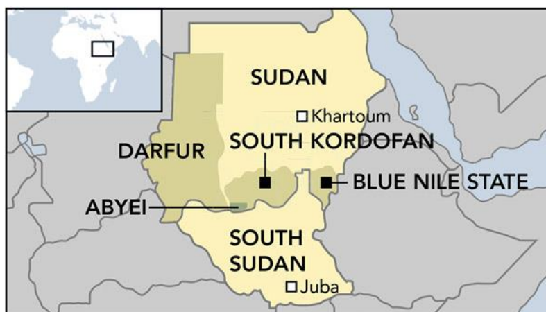
Figuur 2: Map of Darfur and the 'Two Areas', South Kordofan and Blue Nile 9

Dit onderzoek focust op personen afkomstig uit Darfoer, en meer specifiek personen behorend tot niet-Arabische of Afrikaanse gemeenschappen van Darfoer (verder Darfoeri), en op personen afkomstig uit de Two Areas, en meer specifiek personen afkomstig uit het Nuba-gebergte in Zuid-Kordofan behorend tot de Nuba. Volgende twee hoofdstukken bespreken kort de demografische situatie in Darfoer en de Two Areas.