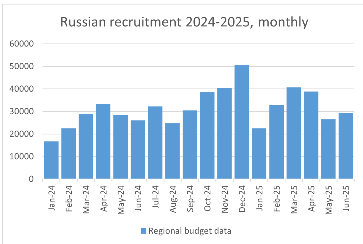
Tabel 1: Inschatting maandelijkse aantal contractsoldaten, Janis Kluge, SWP Berlin.

De Ruslandanalist Janis Kluge van SWP Berlin maakt op zijn beurt een inschatting van het aantal nieuwe contractsoldaten op basis van de gegevens over budgetten van de regio's. Onderstaande grafiek geeft een overzicht van het maandelijkse aantal contractsoldaten voor 2024 – 2025 op basis hiervan 174 :